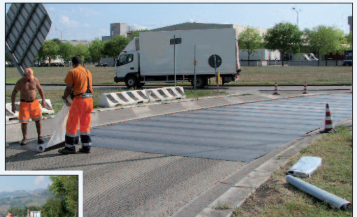
Figura 10 - Un'applicazione della membrana Stratos ARS5 in una rotonda