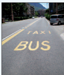
Figure 2 e 3 - L'applicazione della membrana Stratos ARS5 in corrispondenza delle fermate di autobus