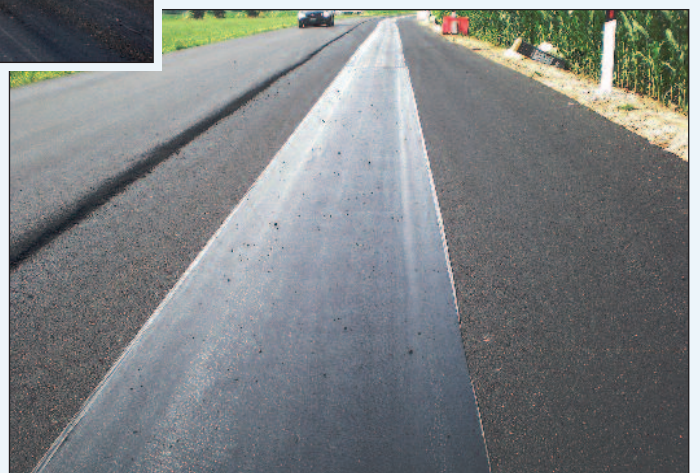
Figura 11 - Un'applicazione della membrana Stratos ARS5 in un allargamento di carreggiata

* Responsabile Marketing di Isoltema SpA