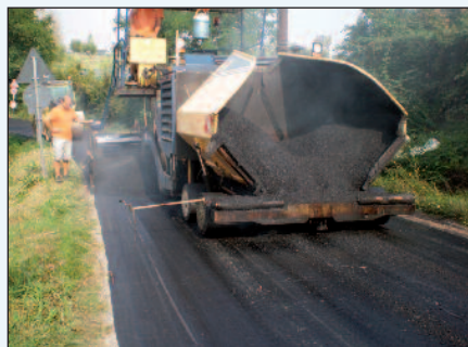
Figure 4, 5, 6 e 7 - Alcune applicazioni della membrana Stratos ARS5

inerti, esercita allo stesso tempo un'azione di ripartizione del carico gravante sugli strati sottostanti e in particolare sulla fondazione e sul sottofondo della sovrastruttura stradale. Un'altra importante caratteristica della membrana Stratos ARS5 è la capacità di rinforzo del tappeto di usura (o del pacchetto binder + usura), grazie alla rete in fibra di vetro a elevata resistenza a trazione annegata nel compound bituminoso.